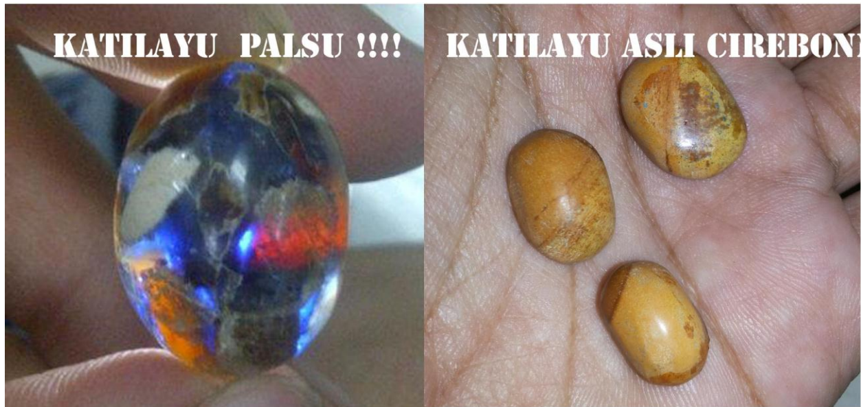
Caption ki ka : blue amber sukabumi, fosil katilayu asli cirebon

banyak seller tidak mempunyai informasi yang jelas.... hanya memanfaatkan / mendompleng nama katilayu untuk MENIPUU !!! hanya untuk kepentingan uang semata.